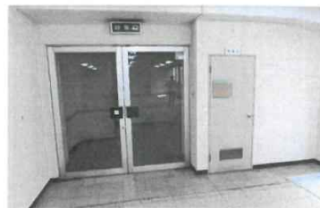
2012年撮影：ネットショップ入居前