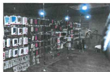
2016年6月撮影：天井塗装(黒)、LEDスポット照明、床ビニタイル