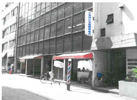
大阪板硝子会館 外観