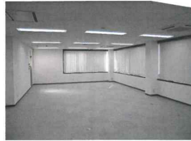
■大きな窓で明るい室内